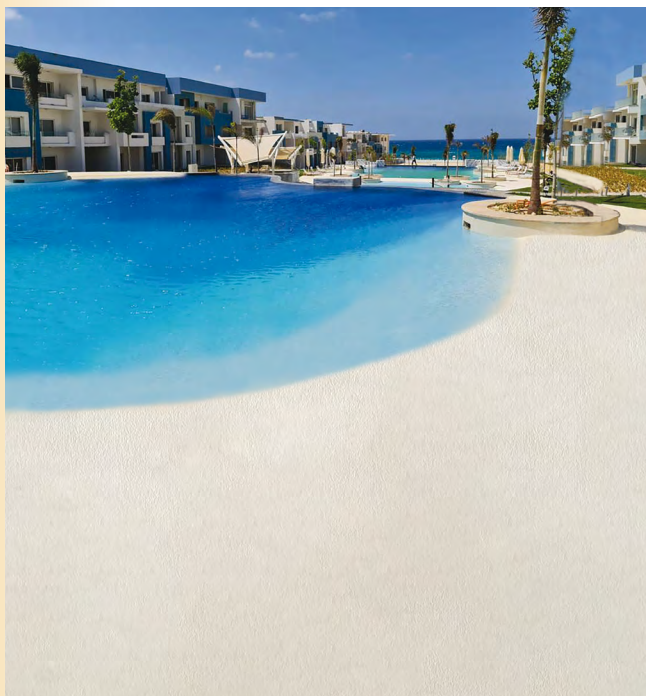
Fouka Bay, North Coast, Αίγυπτος

Παρουσίαση: ISOMAT A.B.E.E. www.isomat.gr ☎ 2310576000