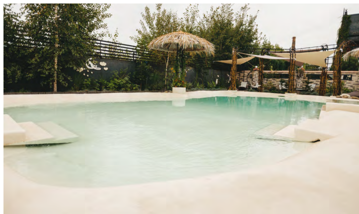
Old Mill Hotel, Σάρνι, Ουκρανία

Οι πισίνες τύπου παραλίας, γνωστές ως beach-entry ή zero-entry pools, αποτελούν παγκόσμια αρχιτεκτονική τάση υψηλής αισθητικής, όπου η εμπειρία της πρόσβασης μιμείται τη φυσική ακτογραμμή και το τελικό φινιρίσμα αποδίδει την υφή και τις χρωματικές διαβαθμίσεις της άμμου, χωρίς αποκόλληση κόκκων. Χαρακτηρίζονται από τη δημιουργία ενιαίων, μονολιθικών επιφανειών χωρίς αρμούς και ενώσεις , οι οποίες εναρμονίζονται πλήρως με το τοπίο και προσφέρουν αυξημένη ελευθερία στον αρχιτεκτονικό σχεδιασμό , τόσο ως προς τη μορφή, όσο και ως προς τη χρήση.