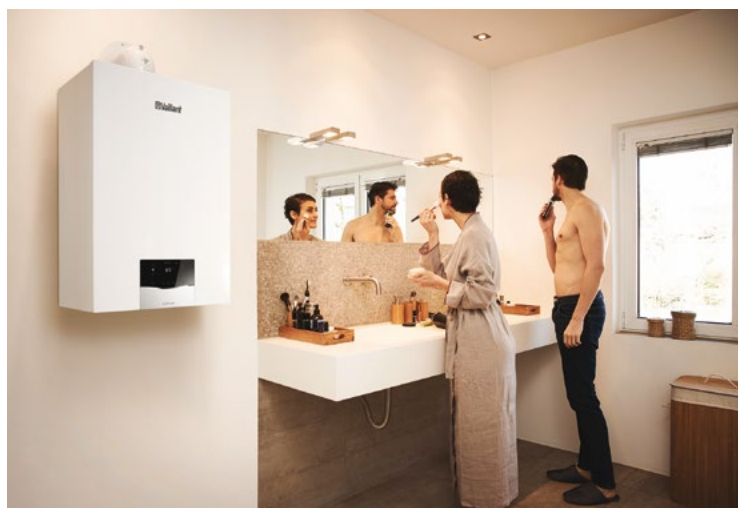
ecoTEC plus: ΤΕΛΕΙΑ ΛΥΣΗ ΓΙΑ ΚΑΘΕ ΣΠΙΤΙ.

ΚΟΡΥΦΑΙΑ ΤΕΧΝΟΛΟΓΙΑ MADE IN GERMANY, ΜΕ 8 ΧΡΟΝΙΑ ΕΓΓΥΗΣΗΣ.