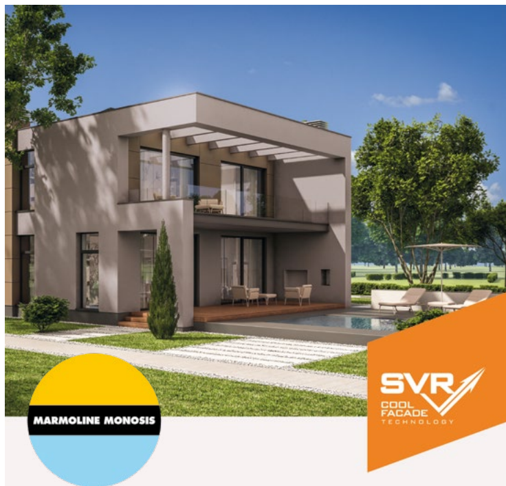
ΤΟ ΣΥΣΤΗΜΑ ΜΑΡΜΟΛΙΝΕ ΜΟΝΟΣΙΣ ΑΠΟΤΕΛΕΙ ΤΗΝ ΙΔΑΝΙΚΗ ΛΥΣΗ ΓΙΑ ΕΞΑΙΡΕΤΙΚΗ ΘΕΡΜΙΚΗ ΑΝΕΣΗ ΣΤΟ ΧΩΡΟ ΔΙΑΒΙΩΣΗΣ ΚΑΙ ΧΡΗΣΗΣ, ΤΟΣΟ ΓΙΑ ΝΕΕΣ, ΟΣΟ ΚΑΙ ΓΙΑ ΥΦΙΣΤΑΜΕΝΕΣ ΚΑΤΑΣΚΕΥΕΣ.