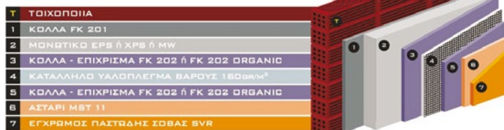
ΤΟ ΤΜΗΜΑ ΕΡΕΥΝΑΣ ΚΑΙ ΑΝΑΠΤΥΞΗΣ ΤΗΣ ΜΑΡΜΟΛΙΝΕ, ΕΙΣΗΓΑΓΕ ΕΝΑ ΝΕΟ ΚΑΙ ΚΑΙΝΟΤΟΜΟ ΣΥΣΤΗΜΑ ΧΡΩΜΑΤΙΣΜΟΥ ΤΟΥ ΠΑΣΤΩΔΟΥΣ ΣΟΒΑΣ SVR ΜΕ ΤΗΝ ΟΝΟΜΑΣΙΑ SVR COOL FAÇADE.