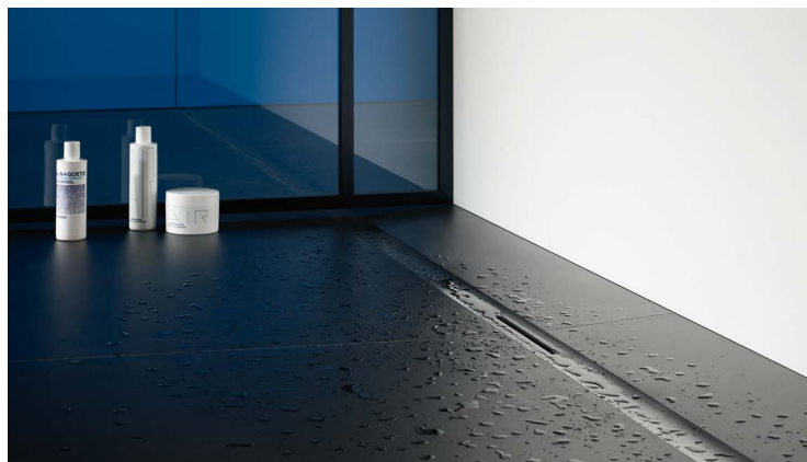
DALLMER CERAFLOOR ΜΕ ΑΝΟΞΕΙΔΩΤΗ ΣΧΑΡΑ ANTHRACITE MATT.