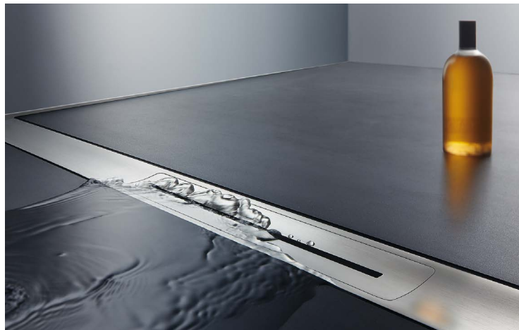
DALLMER CERAFLOOR ΜΕ ΑΝΟΞΕΙΔΩΤΗ ΣΧΑΡΑ SATIN.