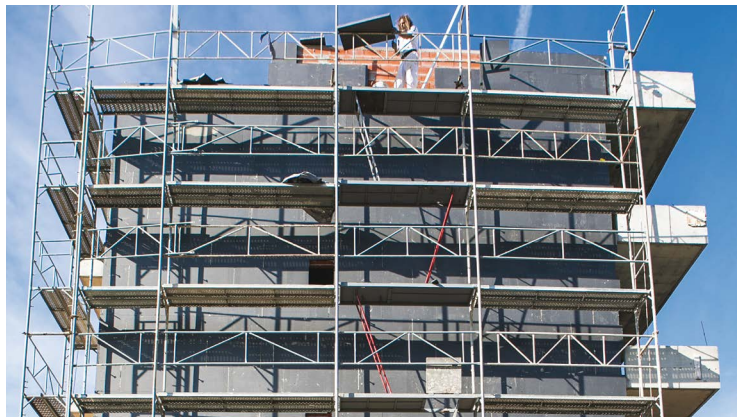
ΕΞΩΤΕΡΙΚΗ ΘΕΡΜΟΜΟΝΩΣΗ ΜΕ ΓΡΑΦΙΤΟΥΧΑ ΔΙΟΓΚΩΜΕΝΗ ΠΟΛΥΣΤΕΡΙΝΗ FELIBLOK PLUS.