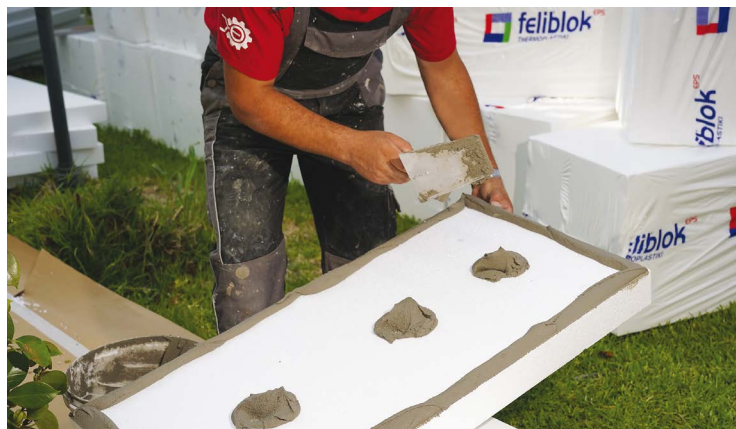
ΕΞΩΤΕΡΙΚΗ ΘΕΡΜΟΜΟΝΩΣΗ ΜΕ ΔΙΟΓΚΩΜΕΝΗ ΠΟΛΥΣΤΕΡΙΝΗ FELIBLOK.