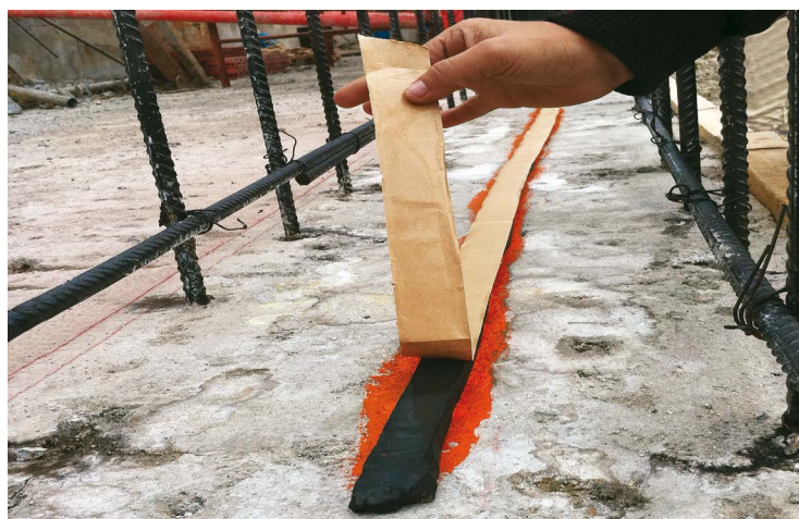
ΒΗΜΑ 2: ΕΦΑΡΜΟΓΗ ΥΔΡΟΔΙΟΓΚΟΥΜΕΝΩΝ ΚΟΡΔΟΝΙΩΝ ΣΦΡΑΓΙΣΗΣ PENEBAR® SW ΣΕ ΑΡΜΟΥΣ ΔΙΑΚΟΠΗΣ ΣΚΥΡΟΔΕΤΗΣΗΣ ΚΑΙ ΣΥΝΑΡΜΟΓΕΣ.