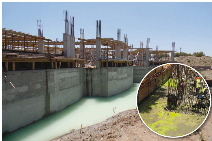
ΒΗΜΑ 1: ΠΡΟΣΘΗΚΗ ΣΤΟ ΣΚΥΡΟΔΕΜΑ ΤΟΥ PENETRON ADMIX® ΜΕ ΧΡΩΣΤΙΚΟ ΔΕΙΚΤΗ.