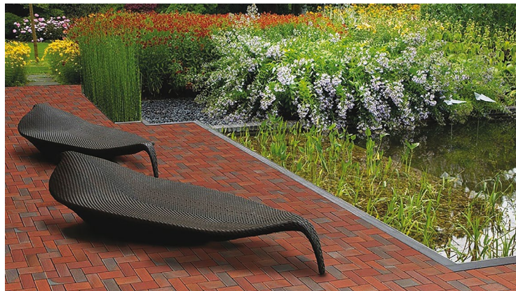
ΚΥΒΟΛΙΘΟΣ KLINKER, ΑΠΟΛΥΤΑ ΕΝΑΡΜΟΝΙΣΜΕΝΟΣ ΜΕ ΤΟ ΦΥΣΙΚΟ ΠΕΡΙΒΑΛΛΟΝ.

Η ενασχόληση της ACM με τα πλακίδια klinker και cotto αρχίζει με τη συνεργασία της με την εταιρεία ΟΞΥΜΑΧΟΝ, την πρώτη ελληνική εταιρεία, που το 1998 παρήγαγε το κεραμικό πλακίδιο klinker για βιομηχανικούς χώρους, για γενική χρήση και τους klinker κυβόλιθους. Μετά το κλείσιμο της ΟΞΥΜΑΧΟΝ και την ενδελεχή έρευνα αγοράς στον ευρωπαϊκό χώρο, η ACM ξεκίνησε τη συνεργασία της με το γερμανικό οίκο INTERBAU-BLINK και έγινε ο αποκλειστικός αντιπρόσωπος στο βιομηχανικό πλακίδιο klinker για τη Νότια Ελλάδα μέχρι και σήμερα. Επίσης, εισάγει το klinker πλακίδιο γενικής χρήσης, τους klinker κυβόλιθους της ABC και τα cotto πλακίδια της SANNINI.