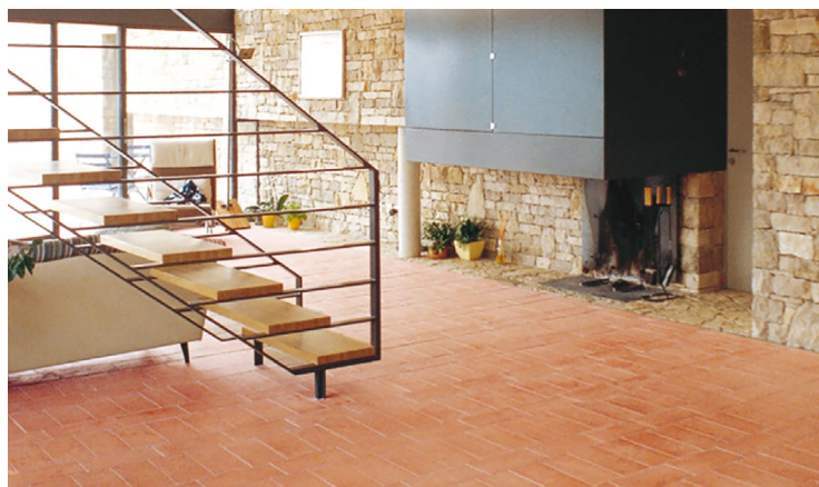
Η ΕΦΑΡΜΟΓΗ ΤΩΝ ΠΛΑΚΙΔΙΩΝ KLINKER ΕΞΑΣΦΑΛΙΖΕΙ ΥΨΗΛΗ ΑΝΤΟΧΗ ΚΑΙ ΔΙΑΧΡΟΝΙΚΟΤΗΤΑ ΣΤΟΥΣ ΕΣΩΤΕΡΙΚΟΥΣ ΧΩΡΟΥΣ.