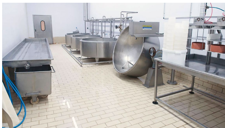
ΒΙΟΜΗΧΑΝΙΚΟ ΠΛΑΚΙΔΙΟ KLINKER ΓΙΑ ΔΑΠΕΔΑ ΥΨΗΛΩΝ ΑΠΑΙΤΗΣΕΩΝ.

Τα cotto πλακίδια είναι ιδανικά για δάπεδα εσωτερικών και εξωτερικών χώρων καθώς διαθέτουν αντοχή, πλαστικότητα και φυσική ομορφιά. Είτε βιομηχανοποιημένα είτε χειροποίητα, τα cotto πλακίδια παράγονται σε πολλά σχέδια, υφές, διαστάσεις και πάχη, στοιχεία που τα ανάγουν στην ιδανική λύση επένδυσης τόσο σε οικιακούς χώρους, όσο και σε έργα ανάπτυξης περιβάλλοντος χώρου.