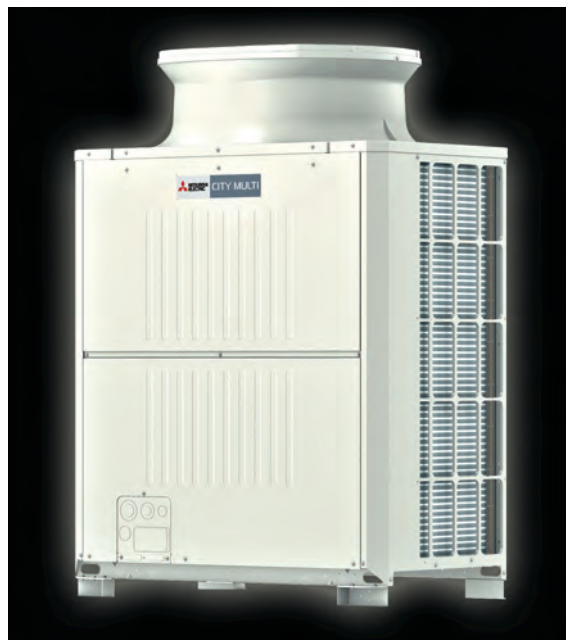
Η ΕΞΩΤΕΡΙΚΗ ΜΟΝΑΔΑ ΤΩΝ ΣΥΣΤΗΜΑΤΩΝ VRF CITY MULTI. ΤΑ ΣΥΣΤΗΜΑΤΑ VRF CITY MULTI ΕΝΣΩΜΑΤΩΝΟΥΝ ΠΡΟΤΟΠΟΡΙΑΚΕΣ ΤΕΧΝΟΛΟΓΙΕΣ ΑΙΧΜΗΣ.