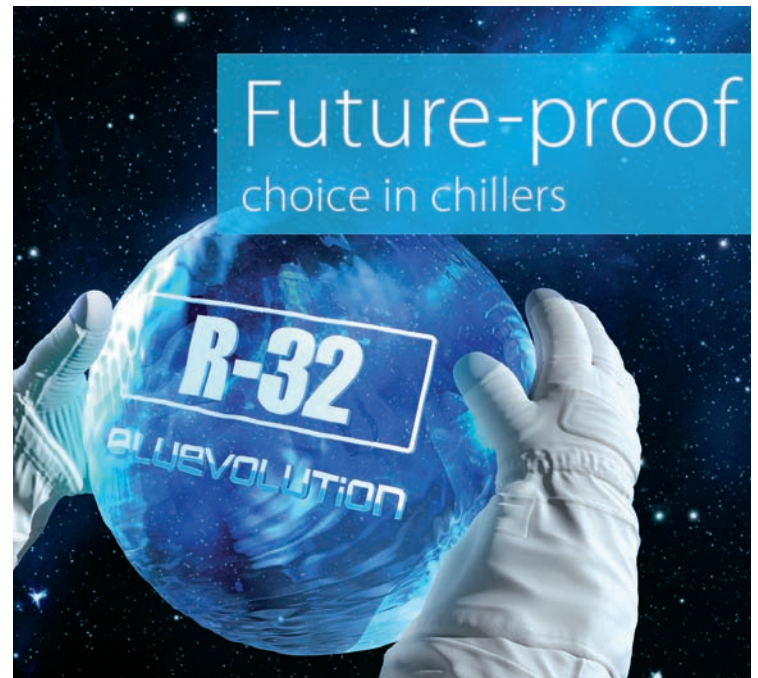
Η ΝΕΑ ΣΕΙΡΑ ΨΥΚΤΩΝ EWAT-B ΕΙΝΑΙ ΕΞΟΠΛΙΣΜΕΝΗ ΜΕ ΤΟ ΝΕΟ ΟΙΚΟΛΟΓΙΚΟ ΜΕΣΟ R-32.

επικοινωνίας και πρόληψης βλαβών "Daikin on Site", διαθέτει ως βασικό εξοπλισμό τον παραλληλισμό master/slave έως τεσσάρων μονάδων και εντάσσεται στο προηγούμενο σύστημα ελέγχου Intelligent Chiller Manager για τον έλεγχο του πρωτεύοντος και δευτερεύοντος υδραυλικού δικτύου μαζί με τα περιφερειακά εξαρτήματα τακτικών μέσων της Daikin.