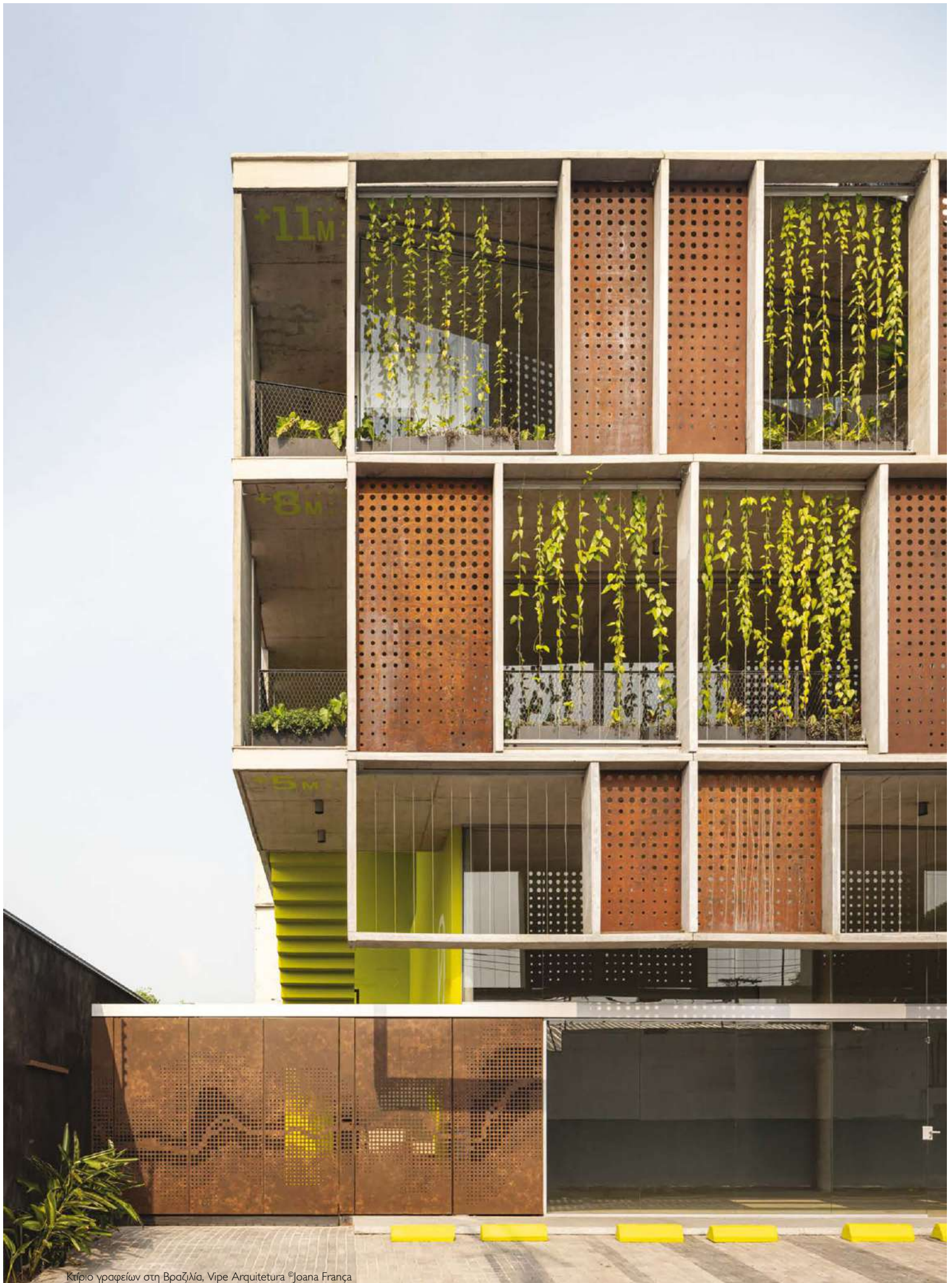
Κτίριο γραφείων στη Βραζιλία, Vipe Arquitetura