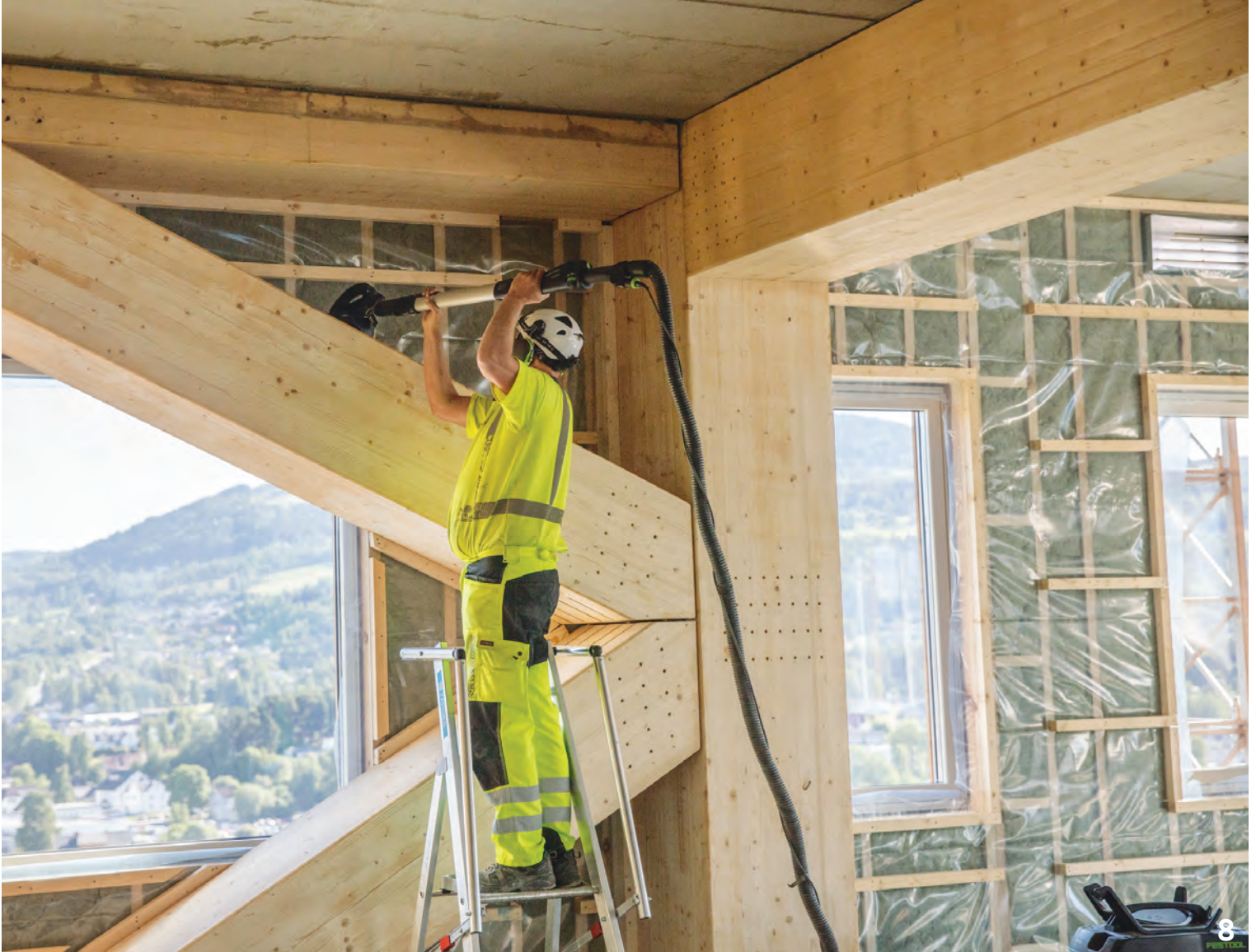
8. Λεπτομέρεια της κατασκευής εσωτερικά του κτιρίου. Τα στοιχεία επικολητής ξυλείας, που συνθέτουν τον ξύλινο φέροντα οργανισμό, συνδέονται με πολλαπλές μεταλλικές πλάκες και βλήτρα.

στηκαν με βάση τη μέθοδο του Ευρωκώδικα I, μέρος 1 - 4 (CEN 2005). Τα αντίστοιχα όρια προσδιορίστηκαν βάσει του προτύπου ISO 10137. Οι επιταχύνσεις και τα αντίστοιχα όρια αφορούν σε φορτίο ανέμου με περίοδο επαναφοράς ενός έτους. Σύμφωνα με τους υπολογισμούς, οι ανεμοεπιταχύνσεις είναι οριακά αποδεκτές στον 17ο όροφο και λίγο επάνω από το όριο στον 18ο όροφο. Ο ιδιοκτήτης του έργου αποδέχθηκε αυτήν τη μικρή παρέκκλιση. Τέλος, η μέγιστη υπολογιζόμενη οριζόντια μετακίνηση στην κορυφή του κτιρίου λόγω του ανέμου ανέρχεται σε 140 mm.