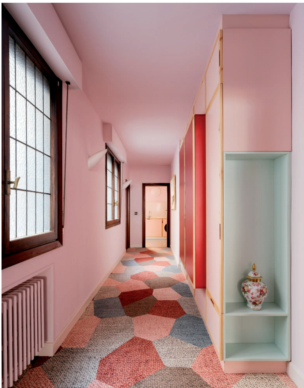
Ανακαίνιση διαμερίσματος στο Μπιλμπάο με μικρές παρεμβάσεις, από τους Azab architects: Η τοποθέτηση μοκέτας, ο σχεδιασμός επίπλου στο ύψος του διαμερίσματος και οι βαφές σε ροζ αποχρώσεις απέδωσαν μία σύγχρονη αισθητική.

μερικές μετατροπές, η οποία βασίζεται τόσο στη σύγχρονη αισθητική, όσο και στη λογική της πολύπλευρης ανακύκλωσης.