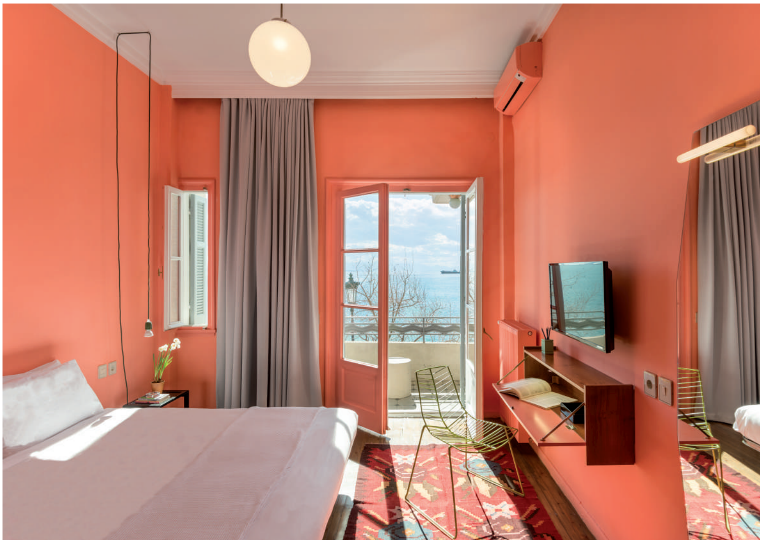
Κατά την ανακαίνιση του διαμερίσματος, το οποίο στεγάζεται σε διατηρητέο κτίριο, συντηρήθηκαν τα αυθεντικά Art Ντεκό στοιχεία, έγιναν σύγχρονες προσθήκες σε εξοπλισμό και δόθηκε ιδιαίτερη έμφαση στη χρήση των βαφών. Αρχιτεκτονική μελέτη: Σταμάτιος Γιαννίκης.

οικονομικές ή ακόμη και σε τεχνικές δυσκολίες, ενώ είναι αρκετά σύνθηες το πρόβλημα της όχλησης (θόρυβος, μεταφορά μπάζων και δομικών υλικών). Αντιθέτως, η εφαρμογή ηπιότερων λύσεων ανακαίνισης μπορεί να προσφέρει ένα αποτέλεσμα με αντίστοιχα οφέλη. Άλλωστε, ανάμεσα στις βασικές παραμέτρους του σχεδιασμού βρίσκεται τόσο η οικονομική ευχέρεια του ιδιοκτήτη, όσο και η τεχνική δυνατότητα εφαρμογής των επεμβάσεων.