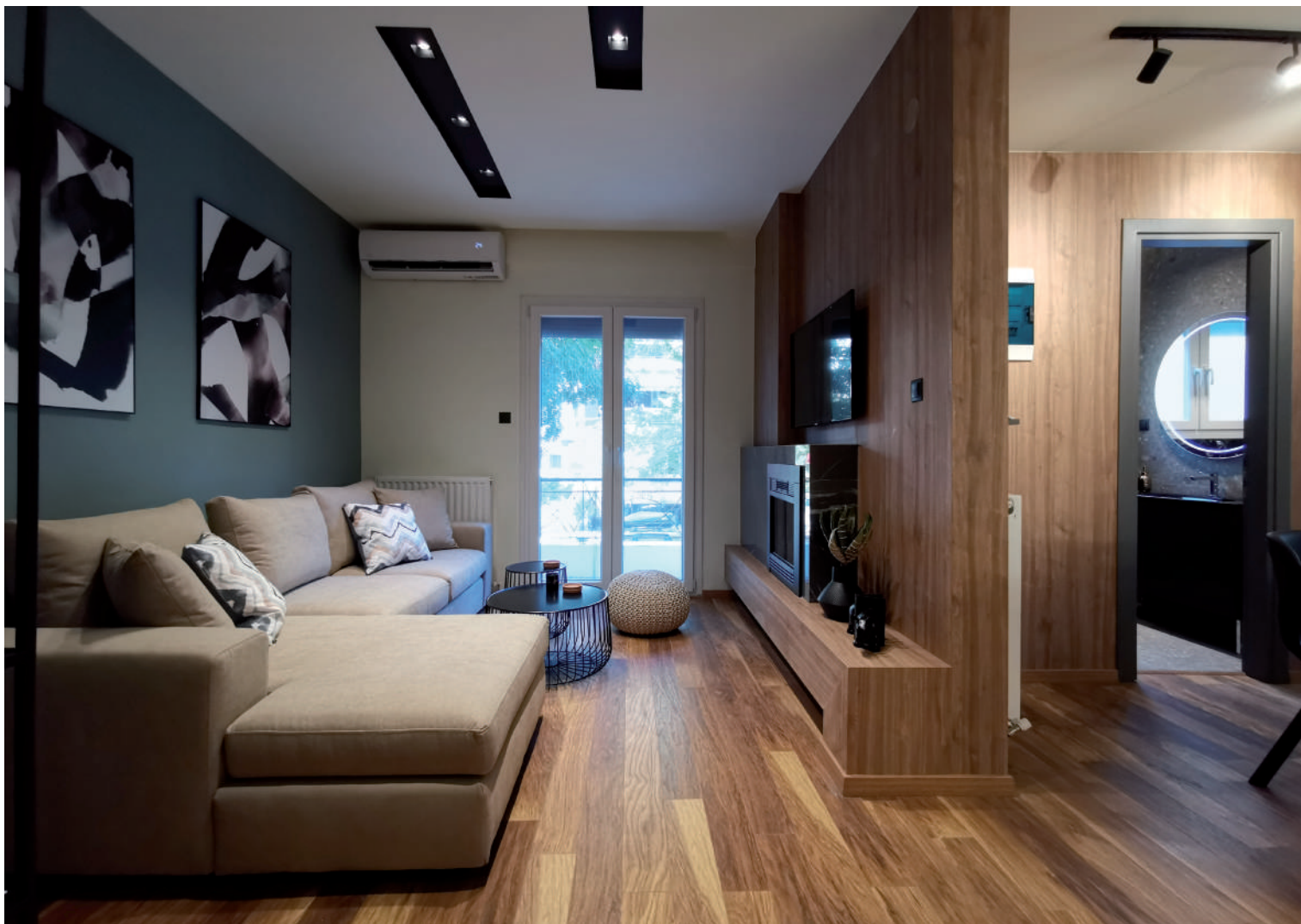
Το πολυστρωματικό δάπεδο και η επένδυση τοίχων με όψη ξύλου σε ανακαίνιση διαμερίσματος προσφέρει ομοιομορφία και κομψότητα.

προϊόντα ξύλου, το οποίο με την κατάλληλη επένδυση μπορεί κάλλιστα να χρησιμοποιηθεί για πλήθος κατασκευών στον εσωτερικό χώρο και κυρίως για ιδιοκατασκευές επίπλων.