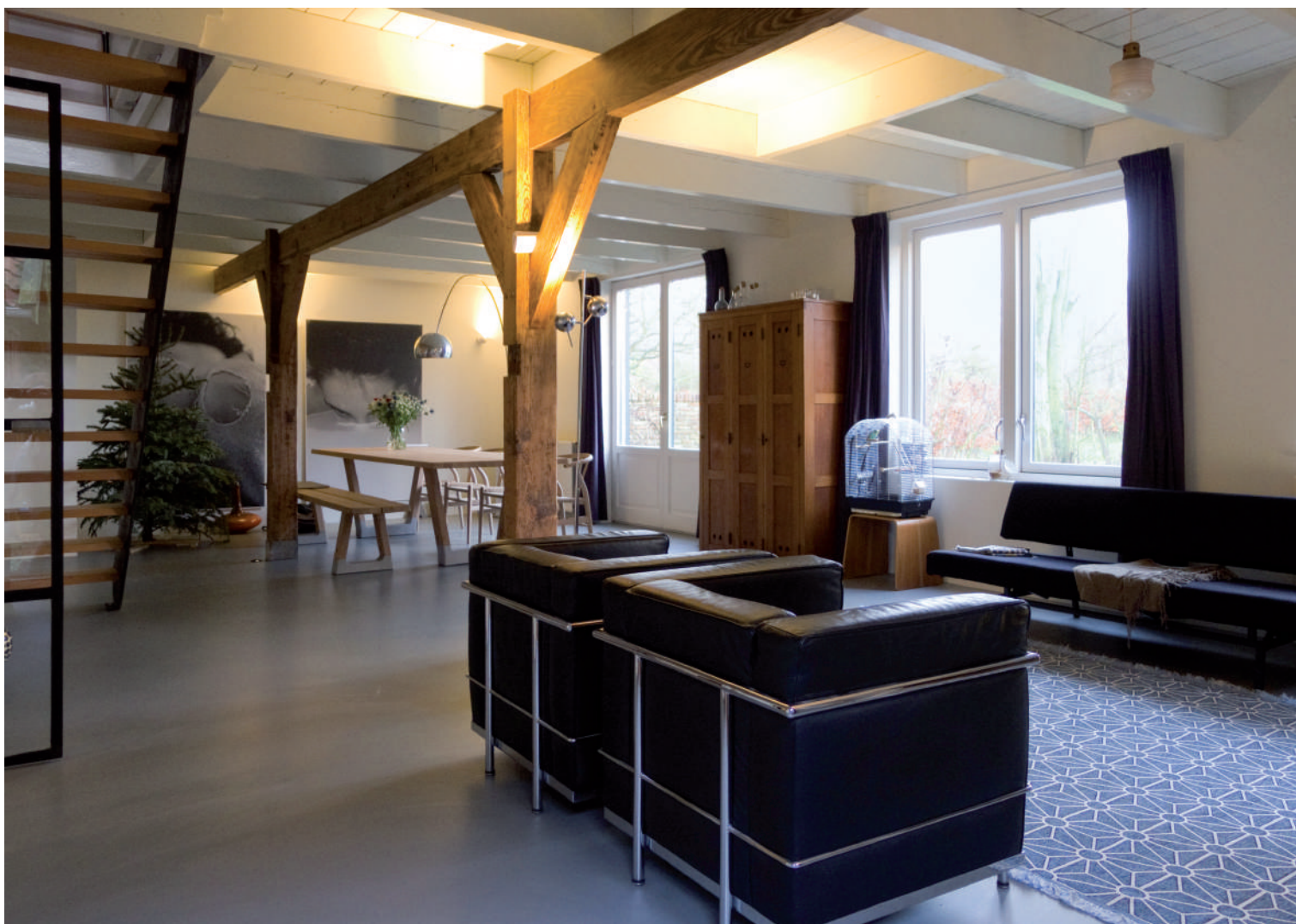
Η λευκή βαφή στην οροφή και το ενιαίο ανοιχτό γκρι δάπεδο πολυουρεθάνης έδωσε στο διαμέρισμα τη φωτεινότητα που αποζητούσαν οι ιδιοκτήτες. Αρχιτεκτονική μελέτη: GFRA Architects.

η δυνατότητα εφαρμογής τους επάνω από τις υφιστάμενες στρώσεις και η ευκολία στην απόσπασή τους. Πρόκειται για ένα υλικό με αρκετά καλή σχέση κόστους / απόδοσης, ενώ έχει και ιδιαίτερα χαμηλό κόστος συντήρησης. Μετά από αρκετά χρόνια εφαρμογής και διάδοσης, τα συγκεκριμένα υλικά έχουν εξελιχθεί σε μεγάλο βαθμό σε ποικιλία υφών, χρωματισμών και κατασκευαστικής ποιότητας (που εξαρτάται κυρίως από τις επί μέρους στρώσεις), ενώ ανάλογα με τις απαιτήσεις, διατίθενται ειδικά πολυστρωματικά δάπεδα, που μπορούν να αυξήσουν την ηχομονωτική και θερμομονωτική ικανότητα του δαπέδου.