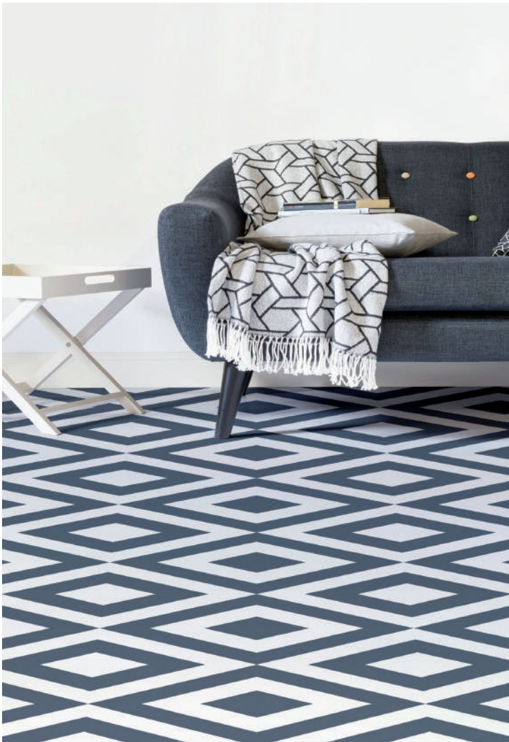
Τα βινυλικά δάπεδα (PVC) αποτελούν μία σχετικά οικονομική λύση, η οποία απαιτεί μικρή συντήρηση και έχει ικανοποιητική αντοχή στο χρόνο. Στην αγορά είναι διαθέσιμα σε ποικιλία σχεδίων.