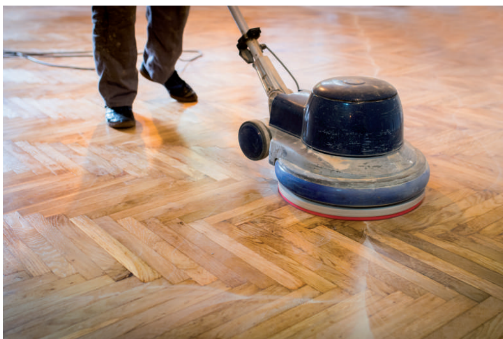
Πριν από κάθε ανακαίνιση πρέπει να εξετάζεται η κατάσταση των υφιστάμενων δαπέδων, καθώς σε αρκετές περιπτώσεις μπορούν εύκολα να επισκευαστούν.

Τα συνθετικά ελαστικά δάπεδα μπορούν επίσης να αποτελέσουν μία λύση με ευκολία και ταχύτητα στην εφαρμογή, ενώ πλέον προσφέρονται σε μία μεγάλη ποικιλία υφών, χρωμάτων, σχεδίων και τεχνικών χαρακτηριστικών. Έτσι, μπορούν να καλύψουν ένα εύρος αναγκών, ακόμη και ειδικών περιπτώσεων, όπως χώρων παιδιών και εκγύμνασης, χώρων υγείας και υγιεινής κ.ά. Απαραίτητη προϋπόθεση για την εφαρμογή των ελαστικών δαπέδων είναι η ύπαρξη μιας λείας και