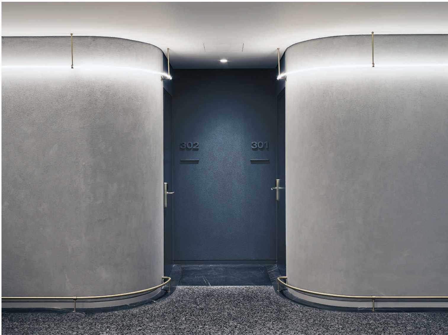
Τα ανάγλυφα γράμματα στους ίδιους χρωματισμούς με την επιφάνεια του τοίχου και ο φωτισμός δημιουργούν ενδιαφέρουσες σκιάσεις και ατμόσφαιρα στους διαδρόμους του "Perianth Hotel" των K-Studio.