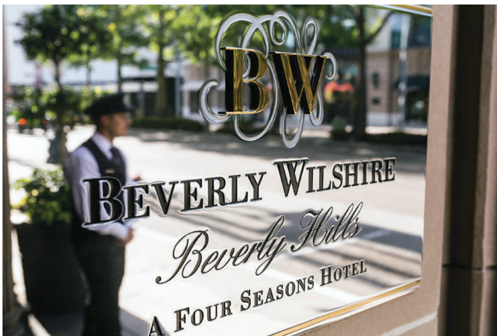
Ιδιαίτερη σημασία έχει η γραμματοσειρά και τα υλικά που επιλέγονται σε κάθε περίπτωση. Υπάρχουν γραμματοσειρές, οι οποίες αποπνέουν ένα χαρακτήρα αριστοκρατικό και ακριβό και θεωρούνται "πολυτελείς".