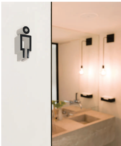
Τα εικονογράμματα πρέπει να είναι κατανοητά από όλους, αλλά αποτελούν και στοιχείο του συνολικού σχεδιασμού.