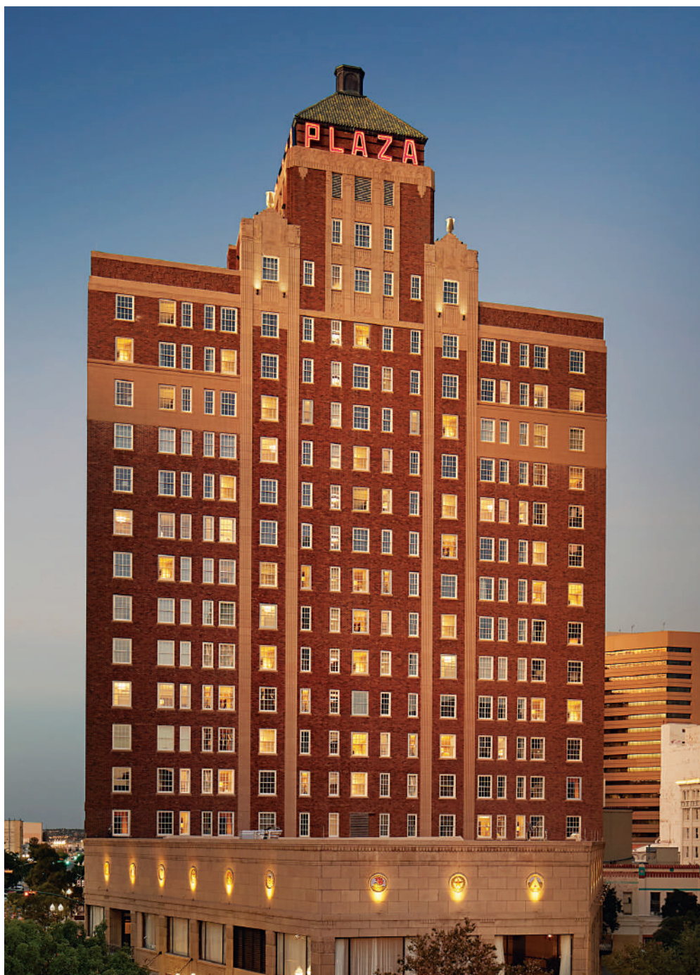
Το ξενοδοχείο "Plaza Pioneer Park", στο Ελ Πάσο του Τέξας. Η χαρακτηριστική επιγραφή του, που χρονολογείται στο 1930, καθιστά το ξενοδοχείο ορόσημο της πόλης.

νουν για το θέμα και το ωράριο της εκδήλωσης ή για τυχόν αλλαγές στο πρόγραμμα. Προσαρμόζονται σε κάθε είδους σχέδιο και μπορούν να αποτελέσουν συνέχεια της ταυτότητας του ξενοδοχείου. Το μεγάλο τους πλεονέκτημα είναι η ταχύτητα, καθώς ανέξοδα και αμέσως μπορεί να αλλάξει το μήνυμα που φέρουν. Έτσι, μπορούν να μεταφέρουν ακόμη και πληροφορίες για έκτακτες συνθήκες αμέσως, χωρίς καθυστέρηση και με σαφήνεια.