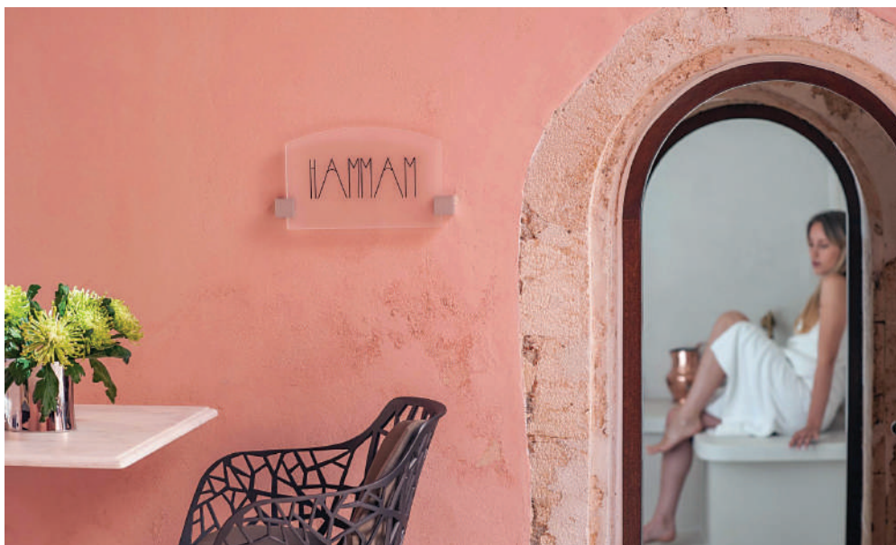
Οι πινακίδες του "Serenissima Boutique Hotel" στα Χανιά της Κρήτης είναι κατασκευασμένες από ημιδιαφανές ακρυλικό γυαλί και προσδίδουν στο κατάλυμα κομψότητα και πολυτέλεια.