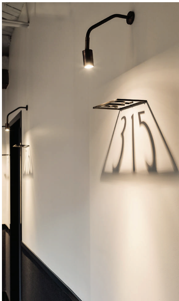
Τα μεταλλικά στοιχεία δημιουργούν φωτοσκιάσεις που ζωντανεύουν το χώρο. "Ovolo Hotel", Σίδνεϊ, Αυστραλία.