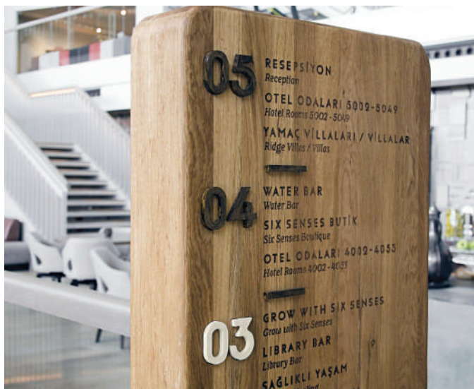
Ξύλινη πινακίδα με εγχάρακτα κείμενα και ανάγλυφα στοιχεία σε εσωτερικό χώρο για υπόδειξη των κοινόχρηστων εγκαταστάσεων του ξενοδοχείου.

πλινθοδομή, γυψοσανίδα, βιτρίνα, κώμα, άμμος κ.ά.), λαμβάνοντας πάντα υπόψη το επιθυμητό αισθητικό αποτέλεσμα.