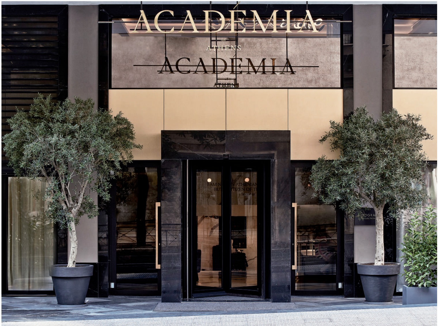
Η κεντρική εξωτερική επιγραφή του ξενοδοχείου "Academia" στην Αθήνα, η οποία διαβάζεται σε δύο επίπεδα με τη σκιά που δημιουργεί, αντικατοπτρίζει τον πολυτελή και εκλεπτυσμένο σχεδιασμό του 5-άστερου ξενοδοχείου. Αρχιτεκτονική μελέτη: MTArchitects. Branding: Sofine.

πιθανόν γραμματοσειρά θα πρέπει να έχει η σήμανση για πρακτικές λειτουργίες, όπως η θέση των κλιμακοστασίων. Με την ίδια λογική, άλλη αντιμετώπιση θα πρέπει να έχει και η σήμανση των υπηρεσιών, όπως των εστιατορίων και των καταστημάτων, καθώς σ' αυτά η σήμανση επιδιώκει να διαδραματίσει διπλό ρόλο, αφενός να ενημερώσει και αφετέρου και να προσελκύει τον επισκέπτη. Πέραν της αισθητικής, η αναγνωσιμότητα έχει ιδιαίτερη σημασία και δεν πρέπει να υποτιμάται.