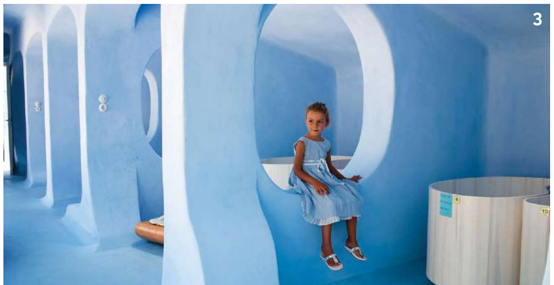
3. Παικνιδόσπιτο ειδικής κατασκευής στο παιδικό χωριό "Aquila Rithymna Beach" στο Ρέθυμνο Κρήτης. Αρχιτεκτονική μελέτη: Polyanna Paraskeva Architects.