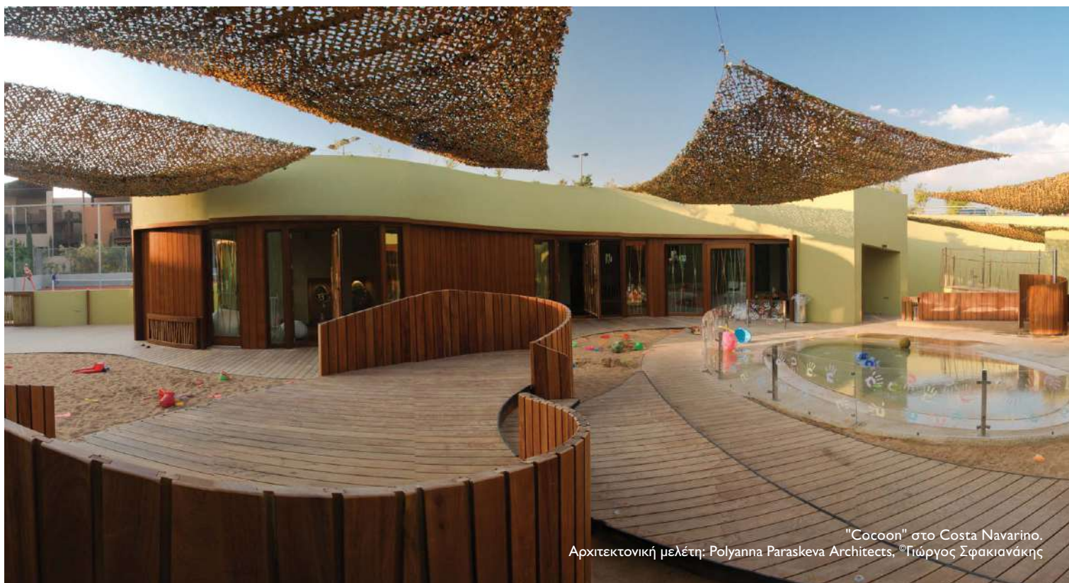
"Cocoon" στο Costa Navarino. Αρχιτεκτονική μελέτη: Polyanna Paraskeva Architects, ©Γιώργος Σφακιανάκης

Η ΑΡΧΙΤΕΚΤΟΝΙΚΗ ΤΟΥ ΧΩΡΟΥ ΤΩΝ ΠΑΙΔΙΩΝ, ΜΙΑ ΝΕΑ ΔΙΑΣΤΑΣΗ ΣΤΟ ΠΕΔΙΟ ΤΗΣ ΣΥΝΘΕΣΗΣ