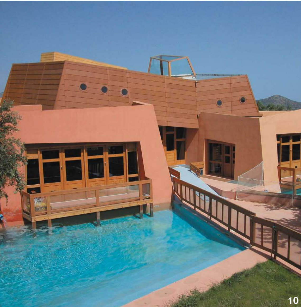
10. Η "Κιβωτός", ως διατήρηση της ζωής και σκεύος διάσωσης του κόσμου των παιδιών, είναι ξύλινη κατασκευή σε βάσεις στιβαρές και όγκους που αναδύθηκαν από το νερό. "Kids' Ark" - "Κιβωτός" στο "Porto Elounda" στην Κρήτη. Αρχιτεκτονική μελέτη: Polyanna Paraskeva Architects. ©Βαγγέλης Πατεράκης.

υπαίθριες δραστηριότητες, η αξιοποίηση του εξωτερικού χώρου προκύπτει αβίαστα. Ο αρχιτέκτονας εντάσσει το δομημένο περιβάλλον μέσα στο φυσικό περιβάλλον και αυτή η ένταξη –που υπηρχει αρχές σεβασμού, ισορροπίας, μέτρου, προστασίας– φέρει εντός της αυτές ακριβώς τις αρχές, τις οποίες το παιδί τις βιώνει, βιώνοντας τον χώρο, έστω και ασυνείδητα. Έτσι, η αρχιτεκτονική σχεδίαση αποκτά και εκπαιδευτικό χαρακτήρα, πέρα από το παιχνίδι, μέσα από την εμπειρία του χώρου.