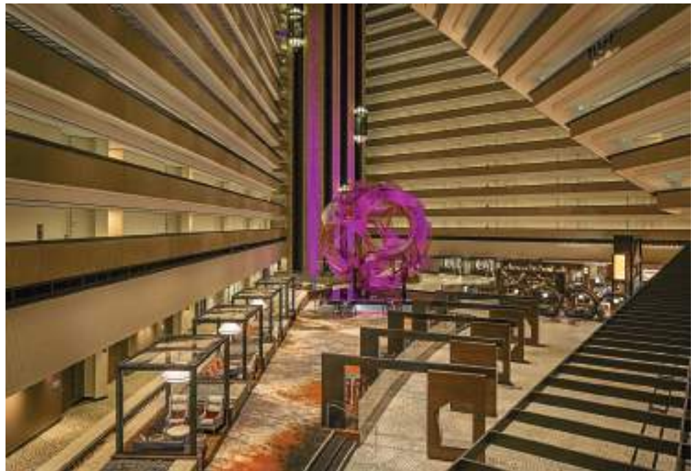
Ο χώρος υποδοχής του ξενοδοχείου "Grand Hyatt" στο Σαν Φρανσίσκο. Η δυναμική του χώρου αναπτύσσεται σε μικρές εστίες ενότητων κοινωνικοποίησης.

Ιδιαίτερη προσοχή πρέπει να δοθεί στην ηχομόνωση του κελύφους των συνεδριακών χώρων με βάση τον κτιριοδομικό κανονισμό και τα διεθνή πρότυπα (EN, ISO, DIN, BS, VDI, ΕΛ.Ο.Τ. κ.ά). Η ηχομόνωση των συστημάτων θέρμανσης και ψύξης παίζουν καταλυτικό ρόλο (σε συνδυασμό με το φωτισμό) στην