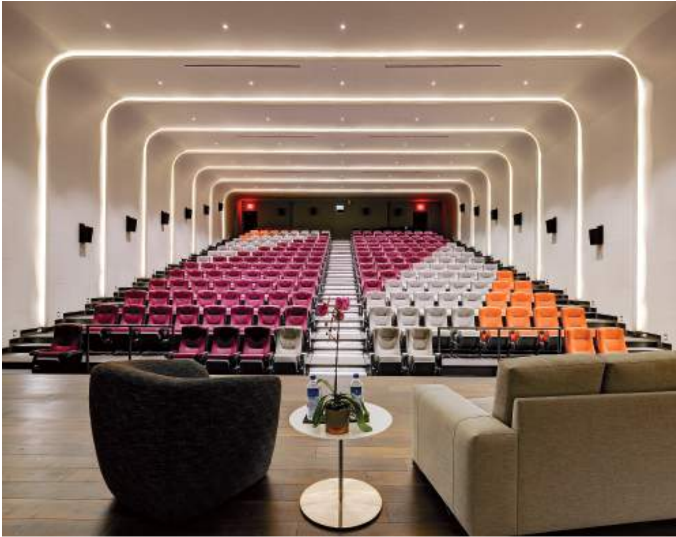
Συνεδριακό κέντρο με διάταξη θεάτρου και υψηλή αισθητική και τεχνολογική υποστήριξη. Ξενοδοχείο "Xtoronto" στον Καναδά.

Η διεξαγωγή συνεδρίων και άλλων σχετικών γεγονότων συνδέεται άμεσα με την επιλογή μιας πόλης ή περιοχής με ισχυρή ή ανερχόμενη ταυτότητα, η οποία παράλληλα προσφέρει πλούσιο τουριστικό υπόβαθρο στους επισκέπτες. Συνεπώς, η άμεση ή έμμεση σύνδεση του αρχιτεκτονικού σχεδιασμού των συνεδριακών κέντρων με διάφορα χαρακτηριστικά της τοποθεσίας, στην οποία βρίσκεται το συνεδριακό κέντρο, ενδυναμώνει τη σύνδεση με τον προορισμό. Μικρές κινήσεις, όπως τα ανοίγματα προς τη θέα (θάλασσα, βουνό, πόλη), η χρήση τοπικών υλικών ή η επιλογή έργων τοπικών καλλιτεχνών σηματοδοτούν τη συνολική εμπειρία του χρήστη στη δεδομένη στιγμή που λαμβάνει χώρα και στις μετέπειτα αναμνήσεις του.