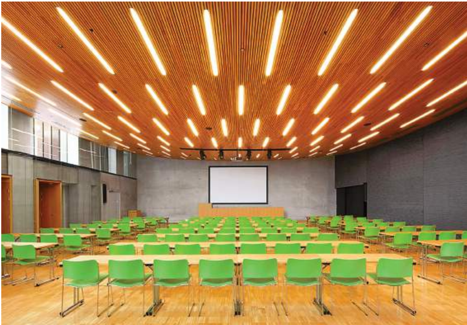
Αίθουσα διαλέξεων στο ξενοδοχείο "Paasitorni Hotel". Έργο των K2S Architects. Η ξύλινη οροφή και οι χρωματισμοί των καθισμάτων δημιουργούν έντονες εικόνες, που εξισορροπούνται από τους ουδέτερους τόνους στους χρωματισμούς και τα ηχομονωτικά πετάσματα των τοιχοποιιών.

ση με την απλή αντιπαράθεση παρουσιάσεων ή ομιλιών. Τα τελευταία χρόνια παρατηρείται η τάση δημιουργίας αιθουσών που αποσκοπούν στην άνεση του χρήστη, στη μείξη ιδεών και σε χώρο που "ρέει" μακριά από το κλασικό μοντέλο των λιτών συνεδριακών κουτιών με την ορθοκανονική διάταξη επίπλωσης. Το ως άνω μοντέλο, αν και θεωρείται βασικό και λειτουργικό, τείνει να μην επιλέγεται πλέον. Οι σύμβουλοι στρατηγικής των ξενοδοχείων ζητούν από τους αρχιτέκτονες να επικεντρωθούν στους χώρους προώθησης της κοινωνικοποίησης και της δικτύωσης των χρηστών, εκεί όπου οι ιδέες και οι άνθρωποι συναντιούνται. Οι χώροι υποδοχής, οι διάδρομοι κυκλοφορίας και κάθε μεγάλο ή μικρό τμήμα / γωνία του συνεδριακού συμπλέγματος αποτελούν εν δυνάμει χώρους κοινωνικοποίησης, εργασίας και ξεκούρασης. Η τοποθέτηση επίπλων (καθιστικά και τραπεζοκαθίσματα) δημιουργούν τις προϋποθέσεις για τη δημιουργία χώρων αναμονής, ανεπίσημων συναντήσεων και το κίνητρο για τη χωρική συγκέντρωση των χρηστών. Σε ορισμένες περιπτώσεις ένα επιπλέον στρώμα διακόσμησης με ράφια, βιβλία, αντικείμενα σπιτιού, χαλιά και ζεστούς χρωματισμούς εντείνουν το κλίμα οικειότητας. Το