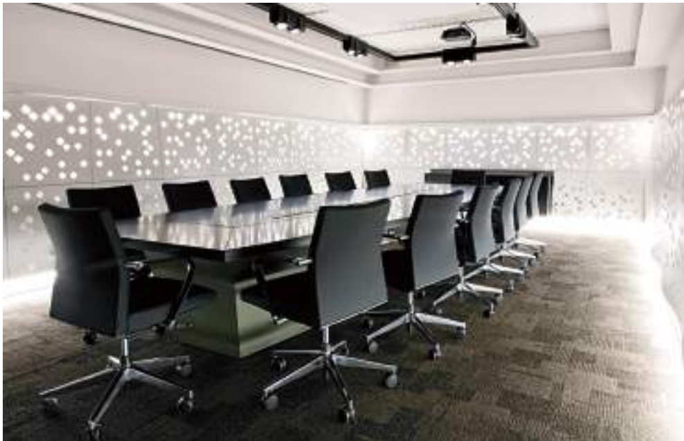
Εντυπωσιακή γλυπτική εγκατάσταση φωτισμού φωτοδιόδων στο Caviar House & Prunier του Τέρμιναλ 2 των διεθνών πτήσεων του αεροδρομίου Heathrow στο Λονδίνο. Μελέτη φωτισμού / Φωτογραφία: Cinimod Studio.

Αναλόγως της χρήσης του χώρου (συνέδριο, επαγγελματική συνάντηση, εταιρική εκδήλωση κ.ά.) αναπτύσσεται και το αντίστοιχο σενάριο φωτισμού. Στην περίπτωση των συνεδρίων και διαλέξεων ο φωτισμός διακρίνεται σε επίπεδα, όπως στο χαμηλό φωτισμό του περιβάλλοντος και στο φωτισμό ειδικού σκοπού για τη σωστή προβολή και τη διευκόλυνση των συνεδρων στη λήψη σημειώσεων. Η ομοιόμορφη κατανομή του φωτισμού μειώνει τις σκιάσεις και τις ανακλάσεις στις οθόνες, ενώ ο ρυθμιστής έντασης φωτός δημιουργεί διαφορετικά σενάρια φωτός. Η εύκολη διαχείριση των συστημάτων φωτισμού, τα διακριτά συστήματα ανά αίθουσα και η συνεργασία των φωτιστικών μέσων με τα οπτικοακουστικά συστήματα αποτελούν προϋπόθεση για τους μελλοντικούς διαχειρι-