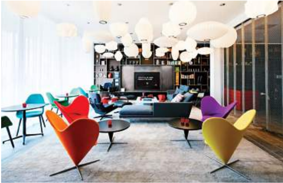
Ξενοδοχείο "CitizenM" στο Ρότερνταμ. Η αίθουσα συναντήσεων αναπτύσσεται σε περιβάλλον με ατμόσφαιρα, χρωματισμούς, υφές και διακόσμηση, που παραπέμπουν σε οικία.